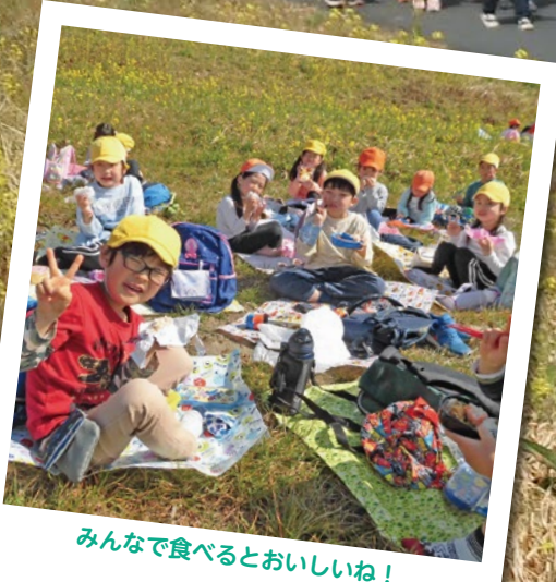
みんなで食べるとおいしいね！