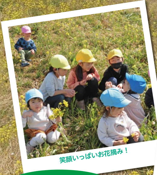
笑顔いっぱいお花摘み！