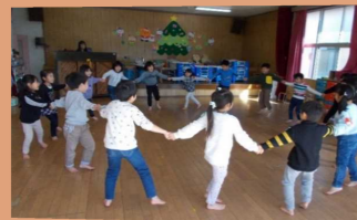
保育所・幼稚園訪問

学校やさわやか相談室、関係機関等との連携を重視し、0歳～15歳までの一貫した教育の推進に努める。