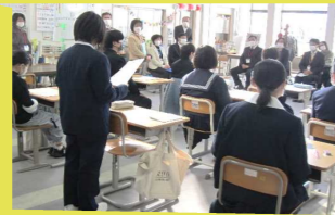
適応指導教室始業式

不登校児童生徒に対し、共感的な理解のもと、社会的自立を促し、学校生活への適応能力を高め、学校復帰に向けた支援の充実に努める。