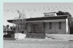
鴻巣典礼センター

こうのす商工葬祭はどなたでもご利用できます 24時間 365日対応 事前相談承ります