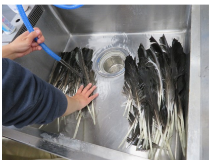
食器用洗剤でやさしく