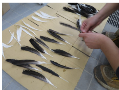
形を整えて干します