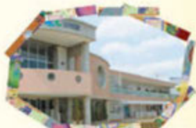
認定こども園 エンゼル幼稚園