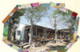
鴻巣ひかり幼稚園