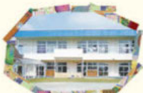
ゆめのはなこども園