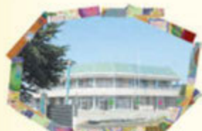
めぐみの木こども園