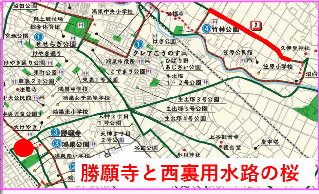
勝願寺と西裏用水路の桜