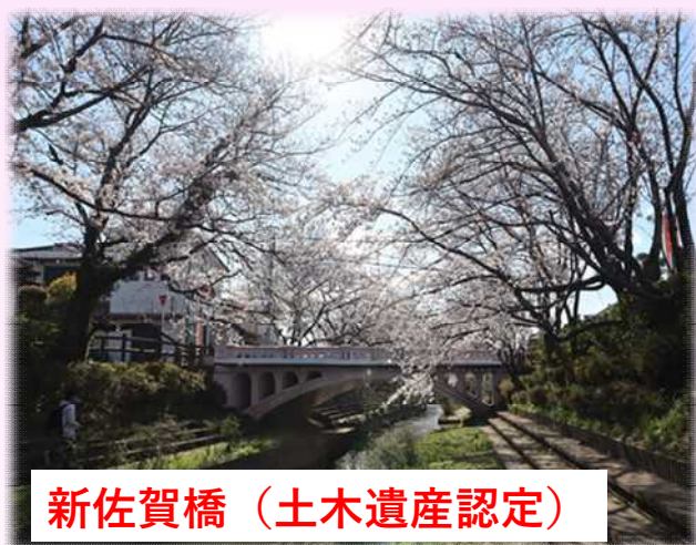
新佐賀橋（土木遺産認定）