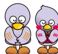
埼玉県マスコット 「コバトン&さいたまっち」