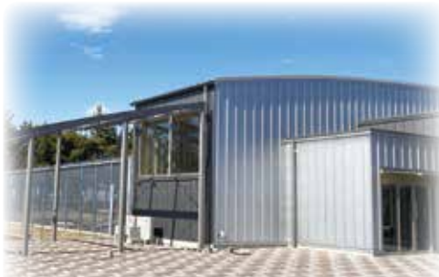
コウノトリ野生復帰センター