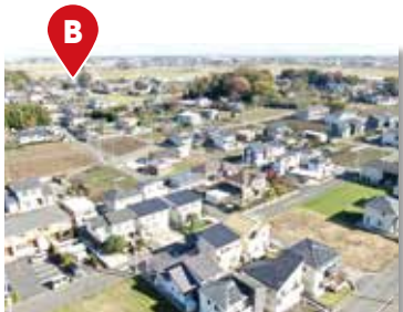
広田中央特定土地区画整理事業