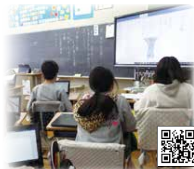
児童・生徒 1 人 1 台 PC 配置