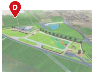
大間近隣公園整備事業