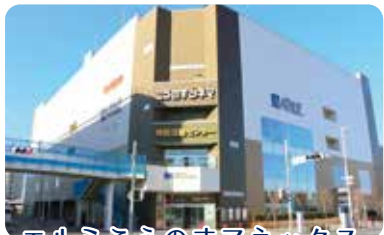
エルミここのすアネックス

平成 22 年 鴻巣中央図書館移転 平成 25 年 市民活動センター・パスポート センターオープン 平成 25 年 ここのすシネマオープン