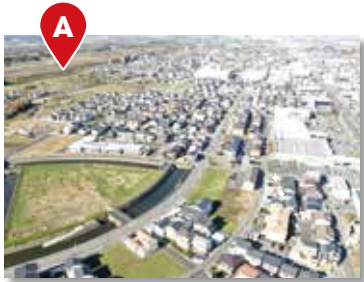
北新宿第二土地区画整理事業

公共施設・避難所・子育て支援施設等の検索は、地理情報提供システム「このとりっぷ」が便利です!