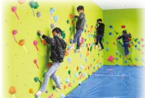
北新宿生涯学習センター・児童センター