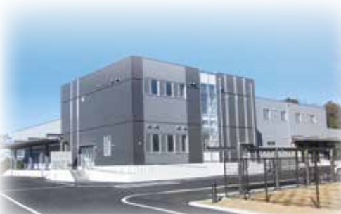
新中学校給食センター