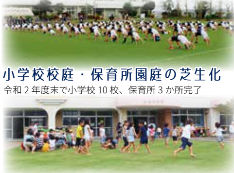
小学校校庭・保育所園庭の芝生化