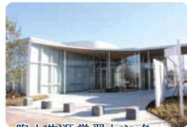
吹上生涯学習センター