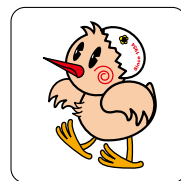
市のメインキャラクター 「ひなちゃん」