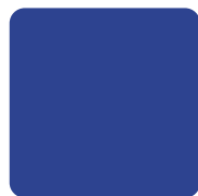
市のシンボルカラー 濃い青色 (ぐんじょういろ)