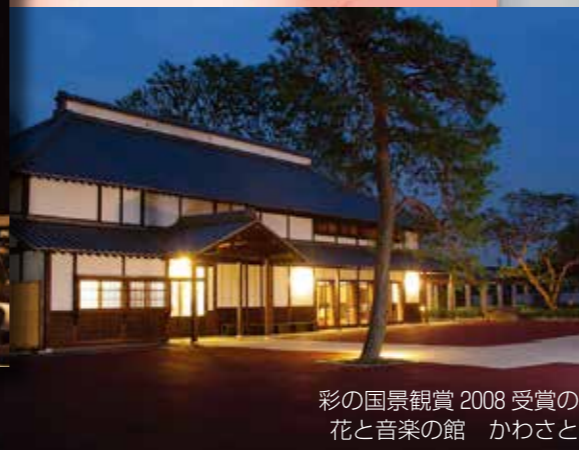
彩の国景観賞2008受賞の 花と音楽の館 かわさと