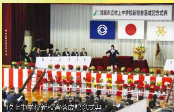
吹上中学校新校舎落成記念式典