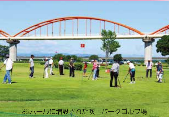
36ホールに増設された吹上パークゴルフ場