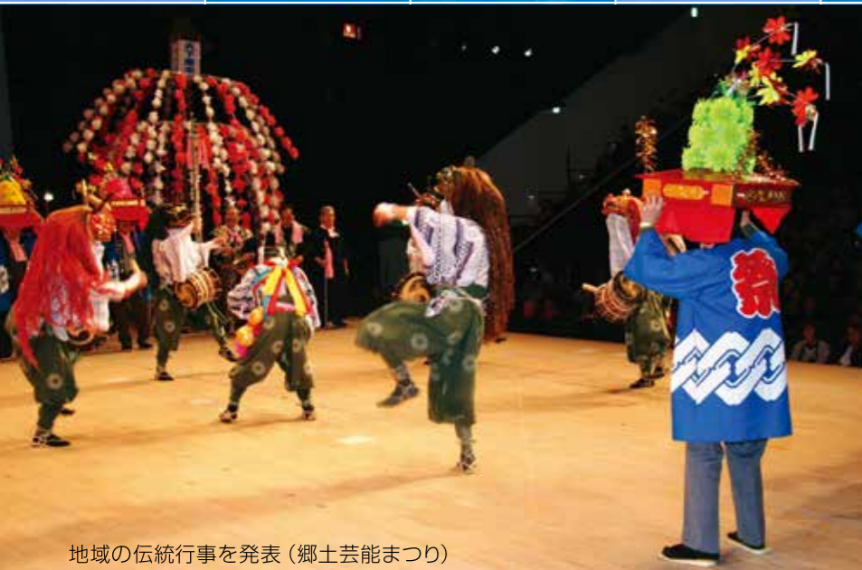
地域の伝統行事を発表（郷土芸能まつり）