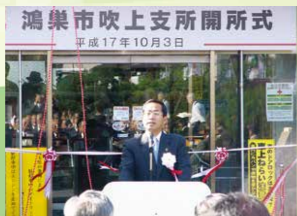
吹上支所開所式(旧吹上町役場)