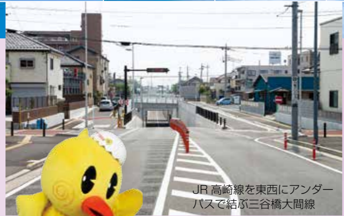
JR 高崎線を東西にアンダーパスで結ぶ三谷橋大間線