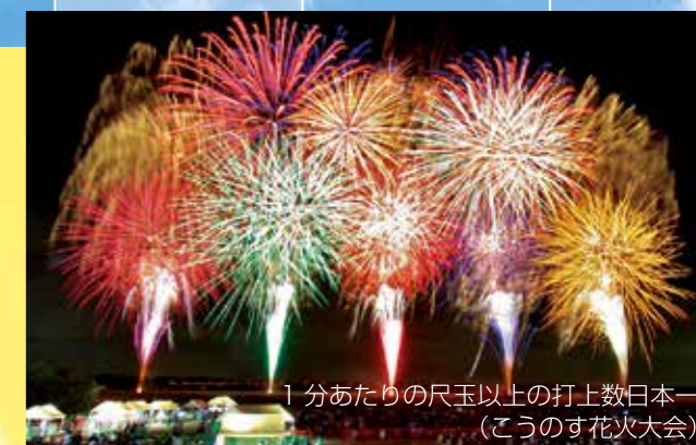
1分あたりの尺玉以上の打上数日本一 (このす花火大会)