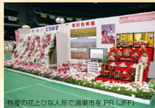
特産の花とひな人形で鴻巣市をPR (JFF)