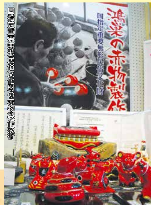
国指定重要無形民俗文化財の赤物製作技術