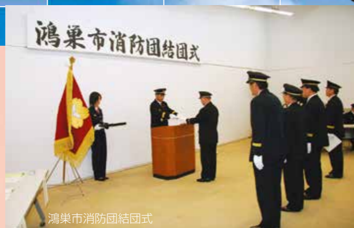
鴻巣市消防団結団式