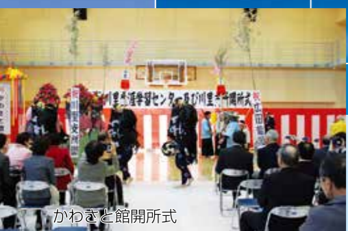
かわさと館開所式