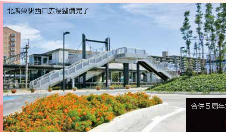
北鴻巣駅西口広場整備完了