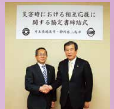
三島市と災害応援協定締結