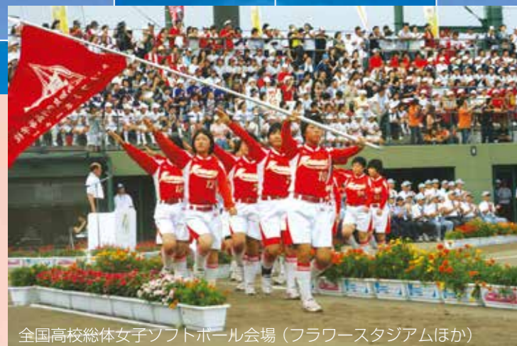
全国高校総体女子ソフトボール会場（フラワースタジアムほか）