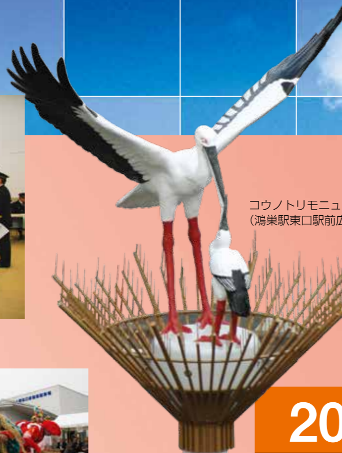
コウノトリモニュメント (鴻巣駅東口駅前広場)