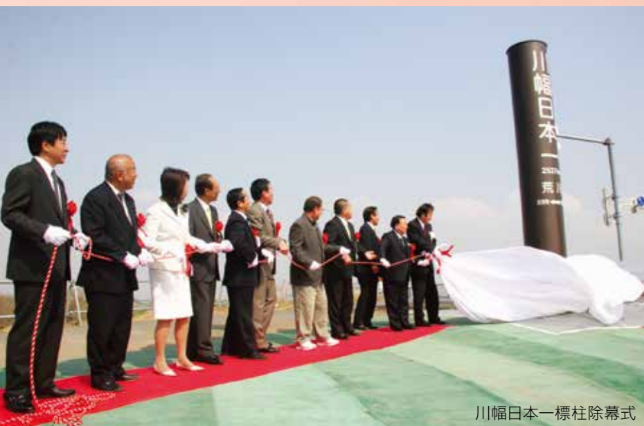
川幅日本一標柱除幕式