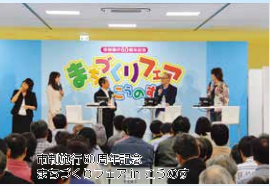
市制施行60周年記念 まちづくりフェア in こうのす