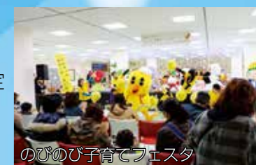
のびのび子育てフェスタ