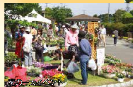
花の一大イベント