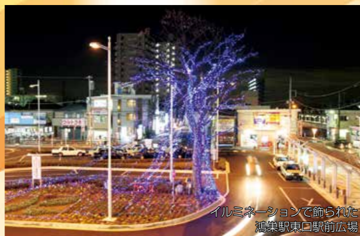
イルミネーションで飾られた 鴻巣駅東口駅前広場