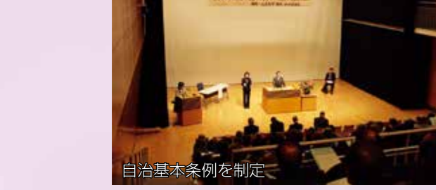
自治基本条例を制定