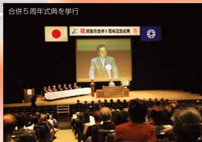
合併5周年式典を挙