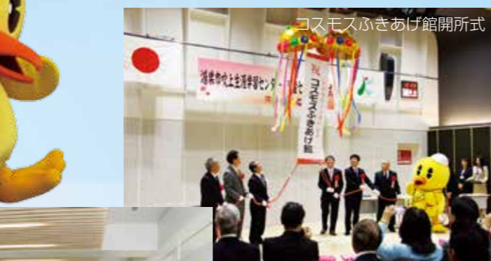
コスモスふきあげ館開所式