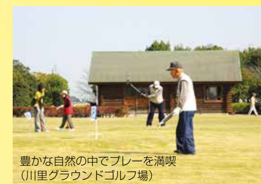
豊かな自然の中でプレーを満喫 (川里グラウンドゴルフ場)