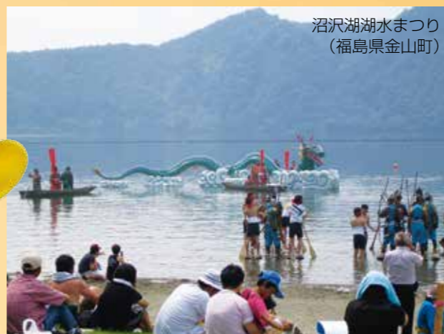
沼沢湖湖水まつり (福島県金山町)