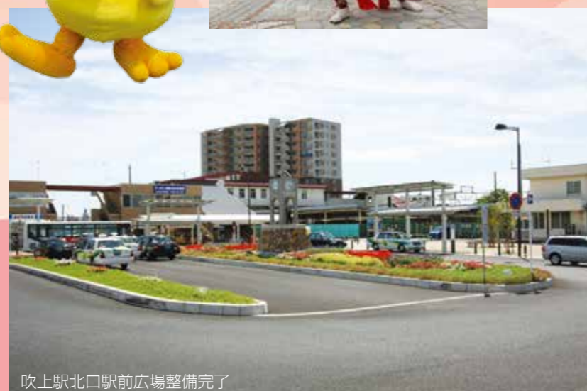
吹上駅北口駅前広場整備完了