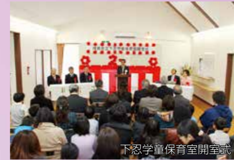
下忍学童保育室開室式