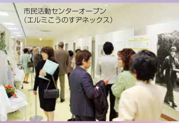
市民活動センターオープン (エルミこうのすアネックス)