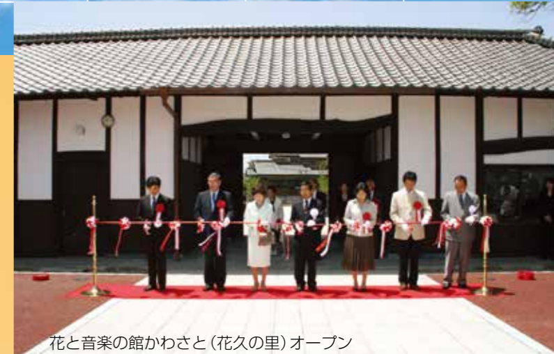
花と音楽の館かわさと(花久の里)オープン