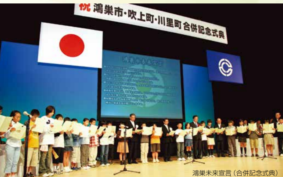
鴻巣未来宣言(合併記念式典)

平成17年10月1日に鴻巣市・吹上町・川里町が合併してから10年が経過しました。時代の流れとともに、私たちのまちも大きく成長しています。10周年の節目を迎え、合併から10年間のまちづくりを写真ダイジェストで振り返ります。