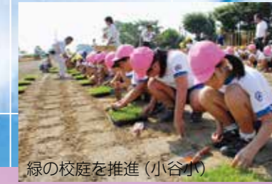
緑の校庭を推進(小谷小)