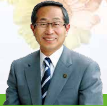
鴻巣市長 原口和久

平成17年10月1日に、鴻巣市、吹上町、川里町が合併し、新たな鴻巣市としてスタートしてから10年が経過いたします。