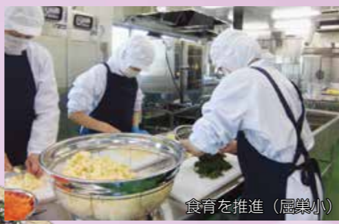
食育を推進(屈巢小)