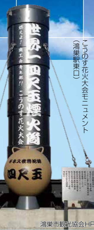
このす花火大会モニュメント（鴻巣駅東口）