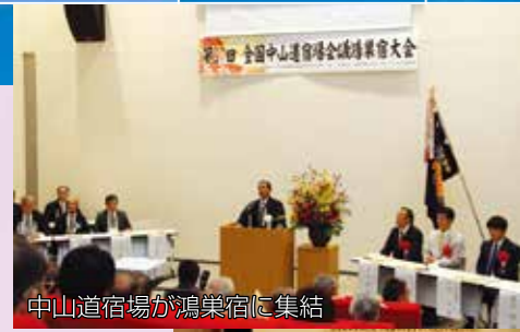
中山道宿場が鴻巣宿に集結