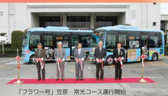
「フラワー号」笠原・常光コース運行開始