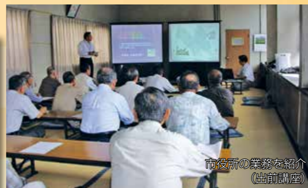
市役所の業務を紹介 (出前講座)