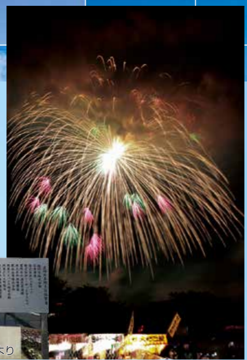
世界一と日本一が楽しめる このす花火大会