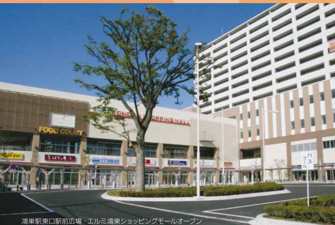
鴻巣駅東口駅前広場・エルミ鴻巣ショッピングモールオープン