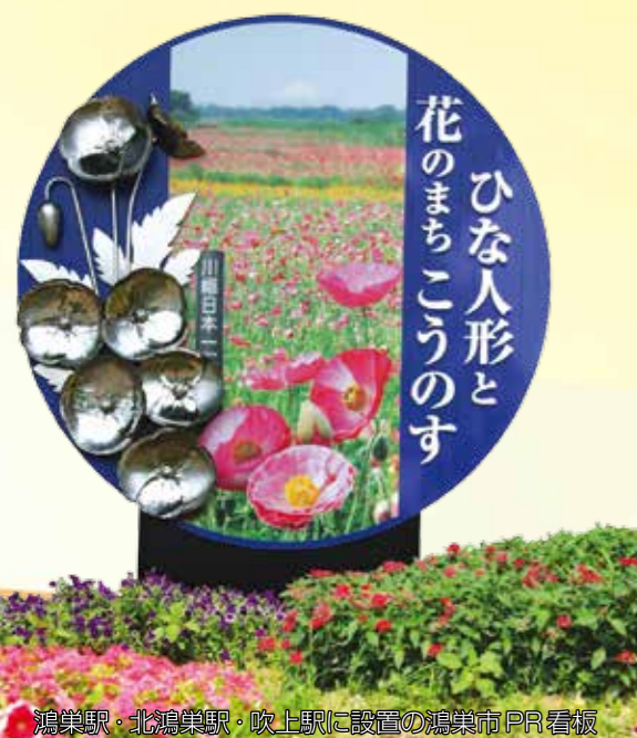
鴻巣駅・北鴻巣駅・吹上駅に設置の鴻巣市PR看板