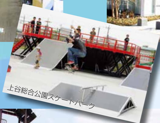
上谷総合公園スケートパーク