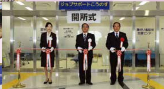
雇用・福祉・産業施策を推進