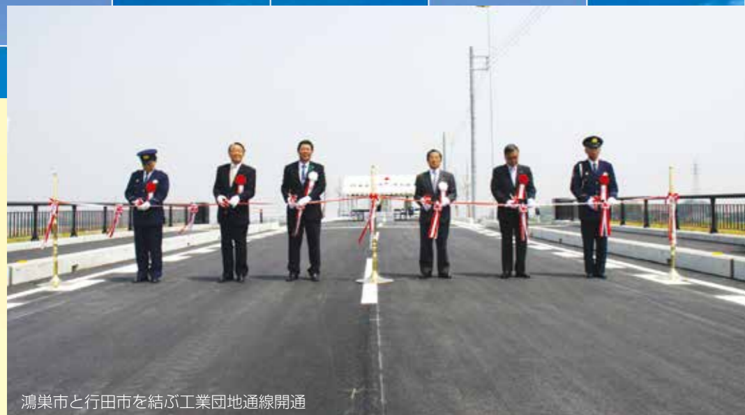
鴻巣市と行田市を結ぶ工業団地通線開通