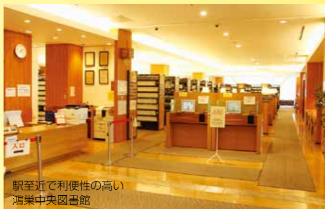
駅至近で利便性の高い 鴻巣中央図書館