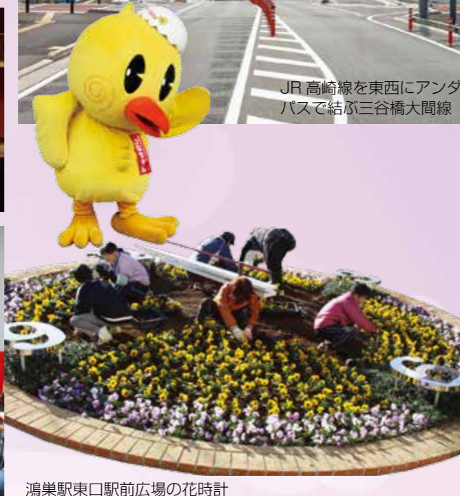
鴻巣駅東口駅前広場の花時計