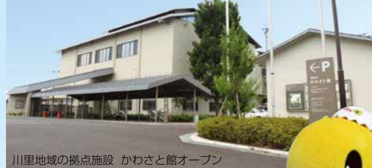
川里地域の拠点施設 かわさと館オープン