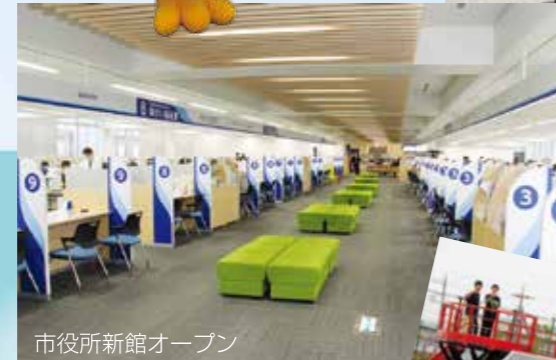
市役所新館オープン