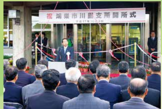
川里支所開所式(旧川里町役場)