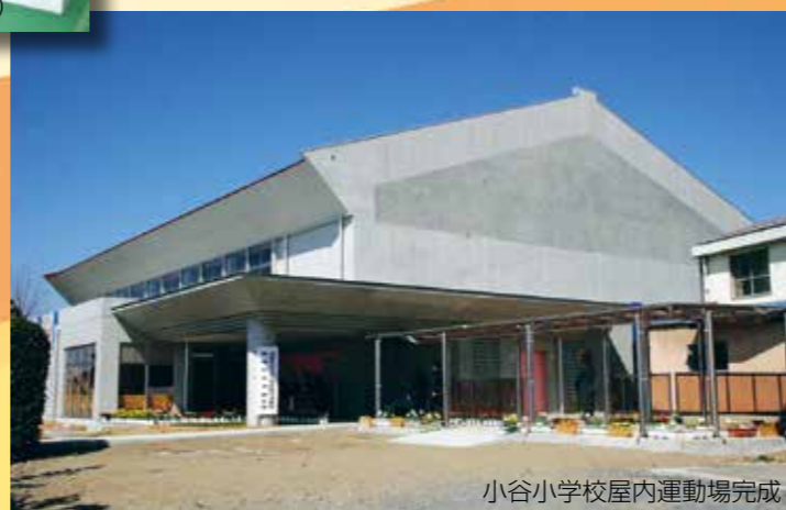
小谷小学校屋内運動場完成