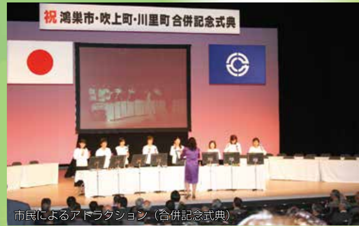
市民によるアドラクション(合併記念式典)