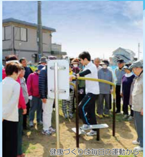
健康づくりは毎日の運動から