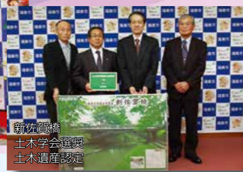
新佐賀橋 土木学会選奨 土木遺産認定