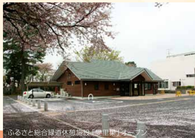
ふるさと総合緑道休憩施設「愛里集」オープン