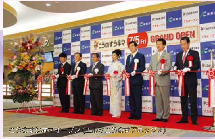
こうのすシネマオープン(エルミこうのすアネックス)