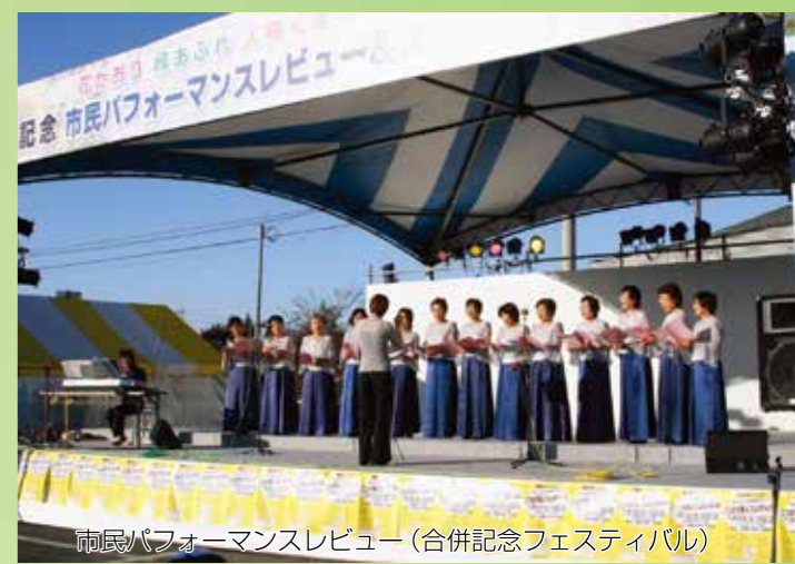
市民パフォーマンスレビュー(合併記念フェスティバル)