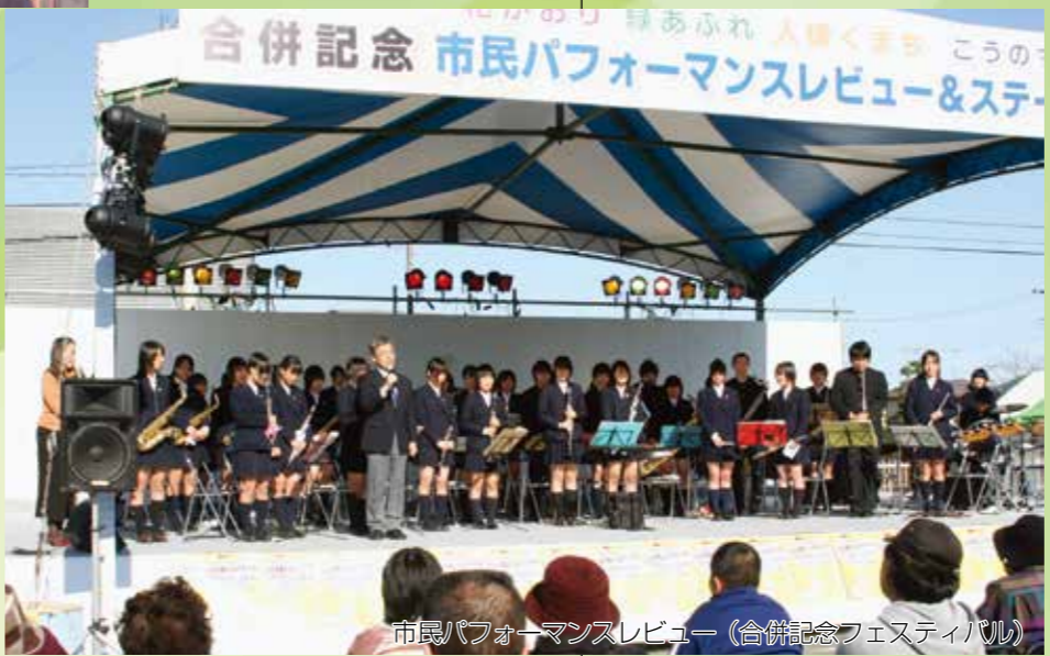
市民パフォーマンスレビュー(合併記念フェスティバル)