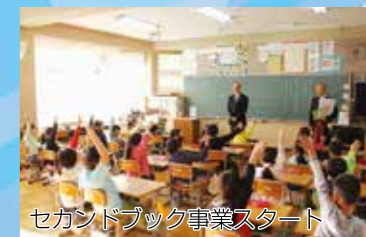
セカンドブック事業スタート