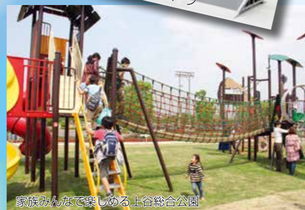
家族みんなで楽しむ上谷総合公園