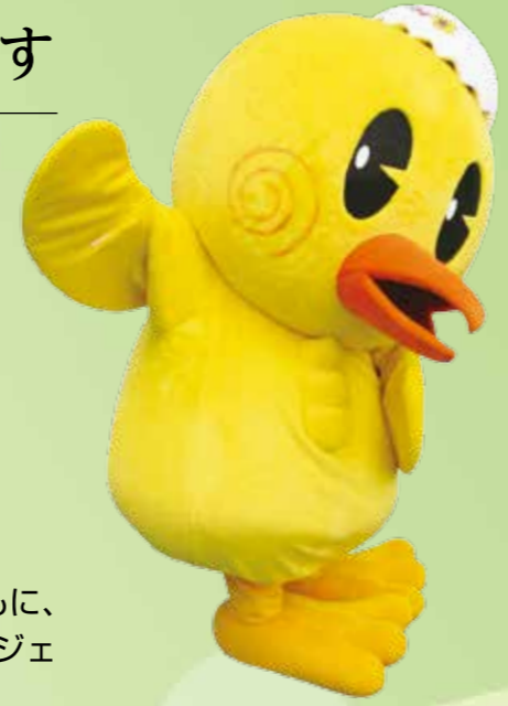
鴻巣市メインキャラクター 「ひなちゃん」