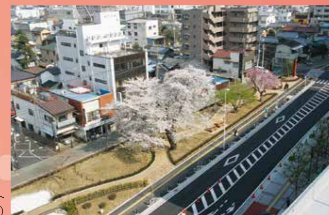
鴻巣駅東口の休憩スポット (エルミパーク)