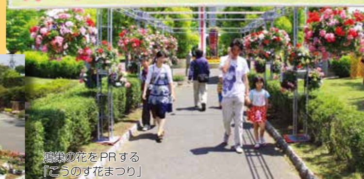
鴻巣の花をPRする 『このす花まつり』