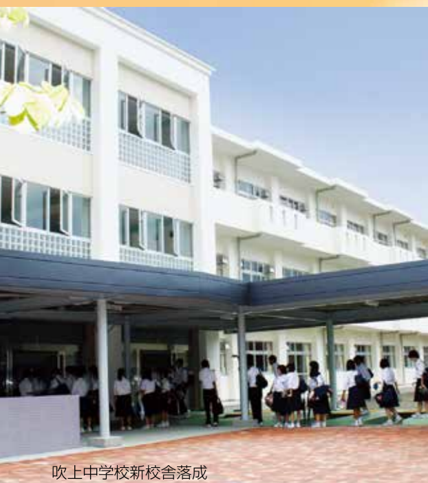
吹上中学校新校舎落成