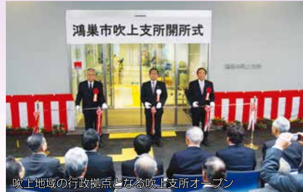
吹上地域の行政拠点となる吹上支所オープン