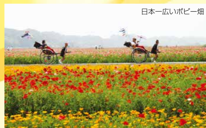
日本一広いポピー畑