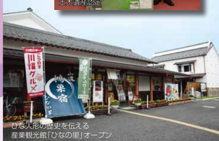
ひなの里の歴史を伝える 産業観光館「ひなの里」オープン