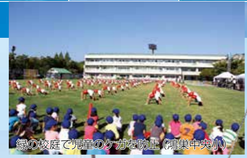
緑の校庭で児童のケガを防止（鴻巣中央小）