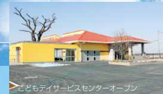
こどもデイサービスセンターオープン