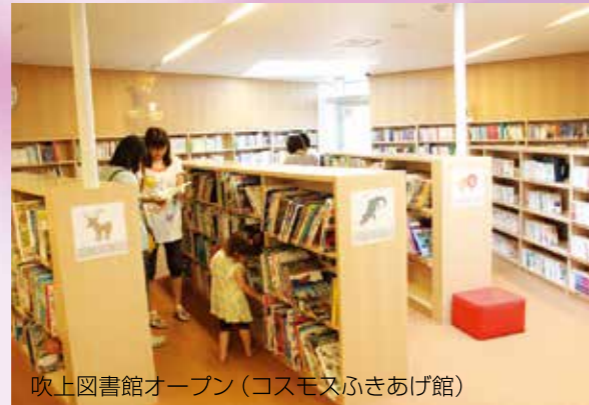
吹上図書館オープン(コスモスふきあげ館)