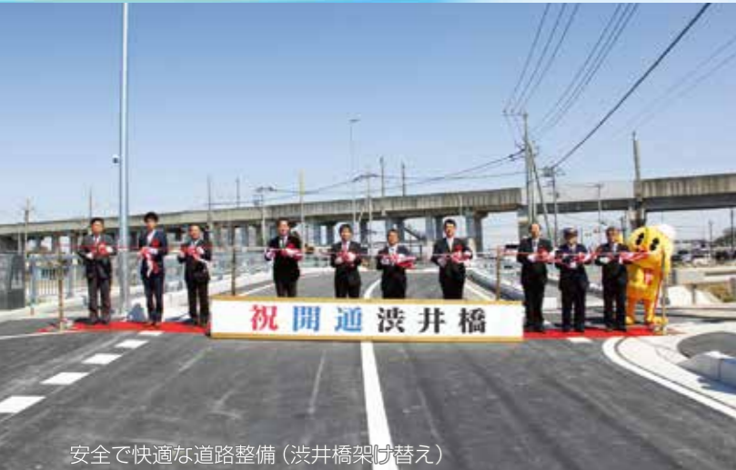
安全で快適な道路整備（渋井橋架け替え）