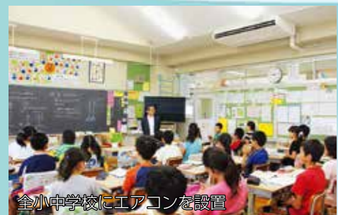
全小中学校にエアコンを設置