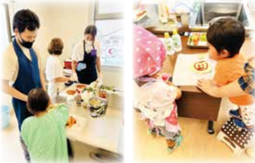
▲オリジナルピザ作りの様子