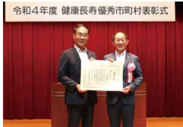
▲大野知事(左)から表彰状を受け取る並木市長(右)