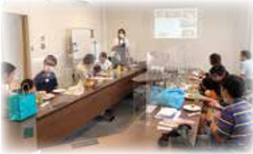
◀講師の話に 耳を傾ける 参加者