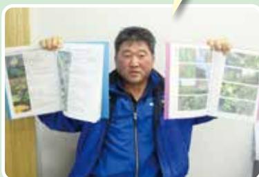
この道48年の大ベテラン

鴻巣市で生まれたコウノトリが鴻巣市の空に羽ばたけるようお手伝いさせていただきます。