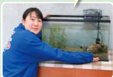
コウノトリ飼育だより「カタカタ通信」編集長!?

生きもの調査などで見つけた魚や水中生物も展示していますので、ぜひ観察してみてください。