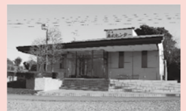
鴻巣典礼センター

このす商工葬祭はどなたでもご利用できます 24時間 365日対応 事前相談承ります