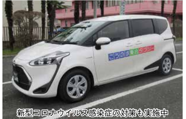
新型コロナウイルス感染症の対策も実施中

※利用希望日の1週間前から1時間前まで予約できます キャンセルする場合は、予約センターに電話してください