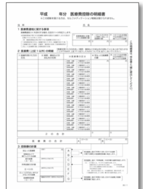
▲医療費控除の明細書

各種様式は、国税庁ホームページ（「国税庁確定申告」で検索）からダウンロードできます