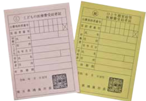
▲受給者証（こどもの医療費＝ピンク色、ひとり親家庭等医療費＝黄色）