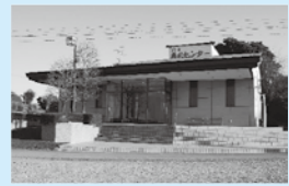
鴻巣典礼センター

このす商工葬祭はどなたでもご利用できます 24時間 365日対応 事前相談承ります