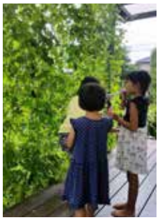
▲平成30年度 生育部門フラワーピース賞