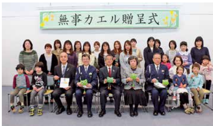
◀交通安全マスコット「無事カエル」 児童の登校・下校を無事カエルまで見守ります