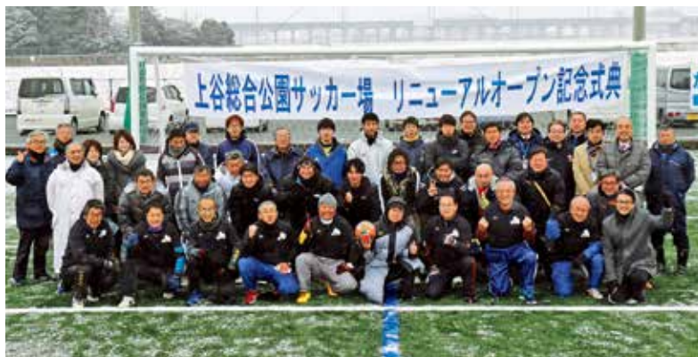
▲サッカー協会及び関係者の皆さんで記念撮影