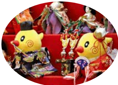
▲ひなちゃんもおしゃれに変身！

市内の各会場でも趣向を凝らしたひな飾りが展示され、15年目を迎え、ますますパワーアップしたひな祭りを市内外からの多くの来場者が楽しみました。