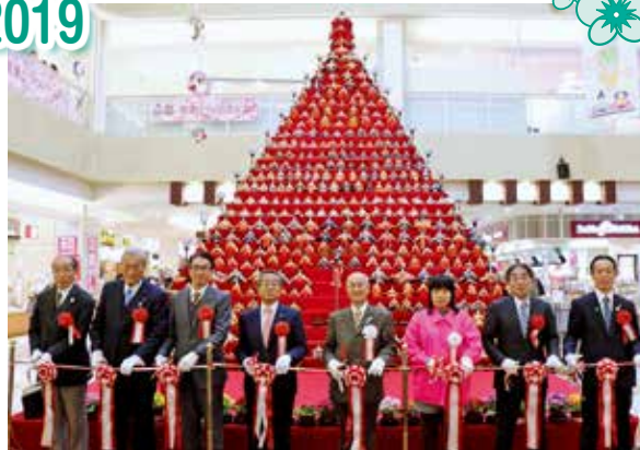
▲オープニングセレモニー 1,833体のひな人形が飾られた日本一高いピラミッドひな壇（31段高さ7m）の前で。