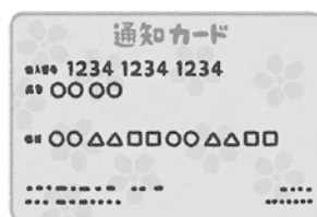
番号確認書類（通知カード等）