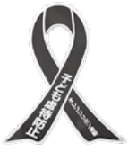
▲オレンジリボン「児童虐待のない社会の実現」を目指す運動のシンボルマーク