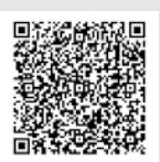
マイ広報紙(インターネットサイト)