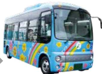
フラワー号無料乗車証（1年間有効）を交付