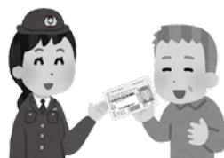
免許証自主返納で

運転免許証の自主返納を促し、高齢者による交通事故の減少及び公共交通機関の利用促進を図ることを目的としています。平成29年度は77人に交付、延べ1403回の利用がありました。