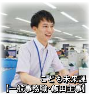
こども未来課 【一般事務職・飯田主事】

① お子さんを養育する家庭に対し、児童手当を支給する業務をしています。 ② こども未来課には、毎日多くの子育てファミリーが来庁されます。市民の方と触れ合う中で、「自身が関わるすべての業務が、次世代を担う子どもたちのためであること」を実感でき、使命感に燃えています。 ③ 人口減少・高齢化の現在において、私たち行政職員の担う役割は、大きな転換期を迎えています。