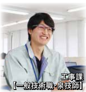
工事課 【一般技術職・泉技師】

① 市内の道路改修、改良工事等を行っており、図面の作成や工事費の積算、現場管理に至るまで担当しています。 ② 工事を行う上で調整や協議を円滑に進めることは、とても重要なことです。そのため、自分で考えた工程で品質の高い成果品ができたときは特にやりがいを感じます。 ③ 専門的な知識が必要で最初は戸惑いもあり、日々の勉強が必要になると思いましたが、この業務を通じて「より住みやすく、魅力あふれるまちづくり」に貢献できることで「やりがい」を感じることが出来ます。ぜひ、私たちと一緒に力を合わせて頑張りましょう！