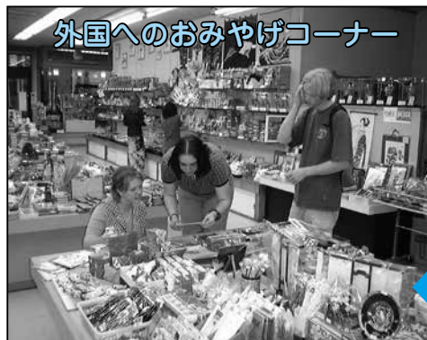
外国へのおみやげコーナー

申・問 市民課住民担当(内線2433・2434)、吹上支所市民グループ(☎548-1212)、川里支所地域グループ(☎569-1111)