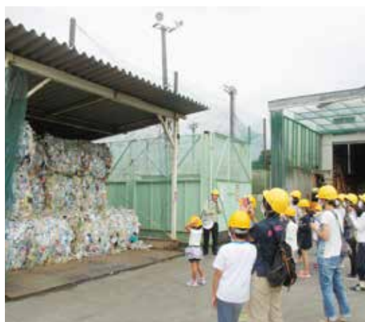
▲ごみの分別の大切さを学びます

申込み・問い合わせ／6月25日(月)～7月13日(金)に電話で環境課廃棄物・リサイクル推進担当（内線3127）