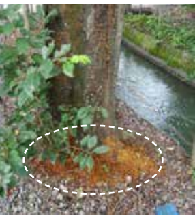
▲フラス 茶色の木くずが多く落ちています。

クビアカツヤカミキリ(特定外来種指定)は、幼虫がサクラやモモ・ウメなどバラ科の樹幹を食害する昆虫です。幼虫1匹の食害範囲が広いので、簡単にサクラが枯れてしまうこともあります。 県内で、成虫やフラス(幼虫のフンと木くずが混じったもの)が確認されており、市内のサクラにもこのカミキリムシによると思われる被害が確認されています。 大切なサクラを守るため、成虫やフラスを見つけた方はご連絡ください。