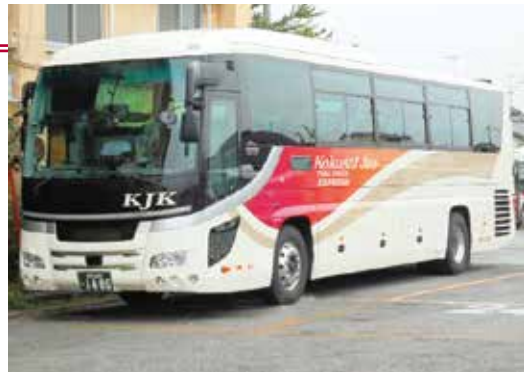
▲運行する車両(一例)