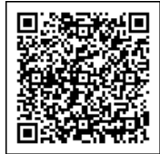
国民保護ポータルサイトモバイル

武力攻撃やテロなどから身を守るために ※事前に確認しておきましょう パソコン、スマートフォンをお持ちの方は「国民保護ポータルサイト」で検索 問 危機管理課 (内線2477)