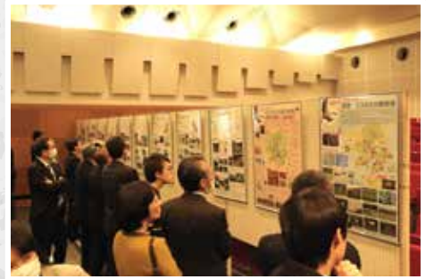
流域エリアの取組を紹介するパネル展示