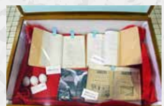
当時の飼育員の日記等、貴重な資料も展示