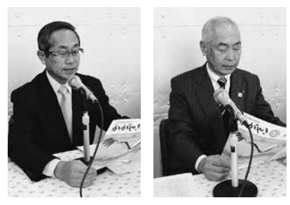
新年のあいさつを読む原口市長(左)と中野市議会議長(右)