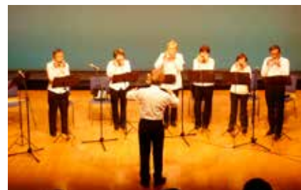
▲ ハーモニカの演奏