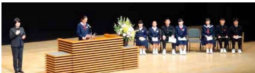
▲ 作文特選者の発表

11月26日、クレアこうのすで「第34回青少年健全育成市民のつどい」が開催され、鴻巣女子高等学校チアダンス部によるオープニング、市内小・中学校から選ばれた作文・習字・啓発ポスター等の表彰、作文特選者による発表、市内小学校によるアトラクションなどが行われました。