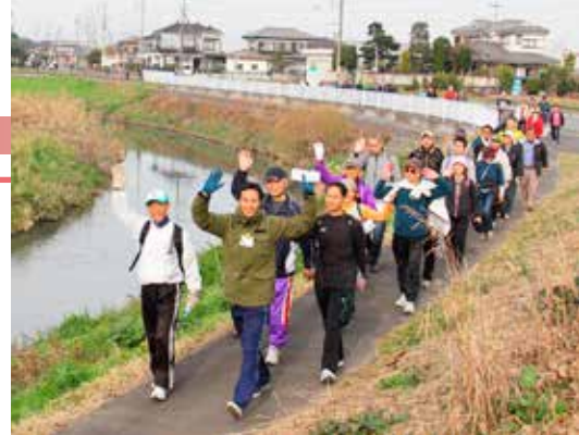
▲ 元荒川のふるさと緑道にて

6つの推奨コースを紹介したマップは、市ホームページや市役所新館、総合体育館、コスモスアリーナふきあげにありますので、ご活用ください。