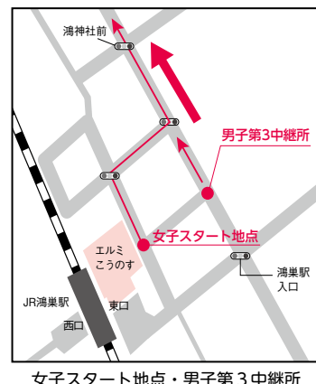
女子スタート地点・男子第3中継所