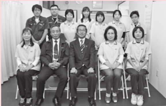
意見交換した従業員の皆さんと記念撮影

アキヤ電気(株)は、昭和44年に創業した会社で、プリント基板実装を主な事業として展開しています。基板実装とは板状の部品に、電子部品や集積回路(IC)を搭載し、それらを繋ぐ金属配線などを半田付けし、回路として動作するものを作ることです。手作業によるきめ細やかな作業もあり、多くの女性従業員も活躍しています。