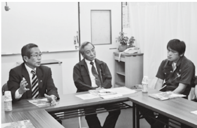
懇談では、たくさんのご意見をいただきました

市長 鴻巣市は今年合併10周年を迎え、10月1日には記念式典を実施し、その中で、健康づくり都市を宣言しました。今後も、ウォーキングやラジオ体操の普及などを通して、人もまちも健康になるようさまざまな施策を推進していきます。 問 市役所で土曜開庁を行っています。仕事の都合で行くことができない場合もあります。日曜日の開庁はできませんか。 答 少しでも市民の皆さんの利便性を向上することは重要ですが、職員の配置に伴う経費等を考慮し、現在行っている土曜開庁(8時30分~12時)をご利用いただくこととしておりますので、ご理解いただきますようお願いいたします。 問 保育所の待機児童について、鴻巣市の現状と今後の見通しを教えてください。 答 待機児童はいない状況ですが、「保留