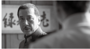
日本のいちばん長い日

戦後70年を迎える今、伝えたい。 日本の未来を信じた人々、その知られざる運命の8月15日。