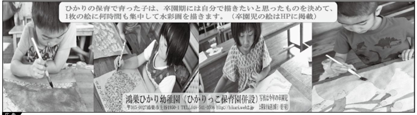
ひかりの保育で育った子は、卒園期には自分で描きたいと思ったものを決めて、1枚の絵に何時間も集中して水彩画を描きます。(卒園児の絵はHPに掲載)

鴻巣ひかり幼稚園(ひかりっこ保育園併設) 写真は今年の卒園児 〒305-0027鴻巣市上谷1950-1 TEL:048-541-3706 http://hikari.web2.jp