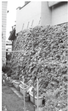
昨年の市長賞受賞作品