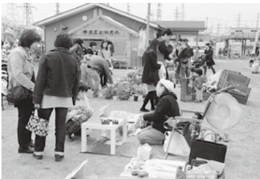
昨年のフリーマーケット

4月18・19日(土・日)に開催の「花のオアシスフェアチュリップまつり」において、フリーマーケットの出店者を募集します。問い合わせ／花のオアシス推進運営協議会事務局(花かおり課内・内線26083) 出店会場 ／花のオアシス隣の市民農園交流広場(全寺台736) 募集区画 ／各日15区画(1区画4m×3m、2日間申込み可) 対象 ／市内在住・在勤の個人又は団体 ※事業者不可 出店料 ／1区画1日1,000円 その他 ／車から荷物を搬入した後、指定の駐車場に移動していただきます ※仮置き以外の目的で市民農園駐車場の使用はできません