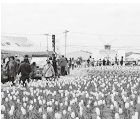
満開に咲いたチューリップ

4月18・19日(土・日)に開催の「花のオアシスフェアチュリップまつり」において、フリーマーケットの出店者を募集します。問い合わせ／花のオアシス推進運営協議会事務局(花かおり課内・内線26083) 出店会場 ／花のオアシス隣の市民農園交流広場(全寺台736) 募集区画 ／各日15区画(1区画4m×3m、2日間申込み可) 対象 ／市内在住・在勤の個人又は団体 ※事業者不可 出店料 ／1区画1日1,000円 その他 ／車から荷物を搬入した後、指定の駐車場に移動していただきます ※仮置き以外の目的で市民農園駐車場の使用はできません