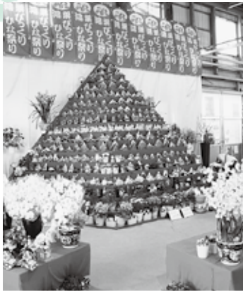
三面ピラミッド型ひな壇