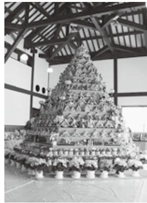
六角すい型ひな壇