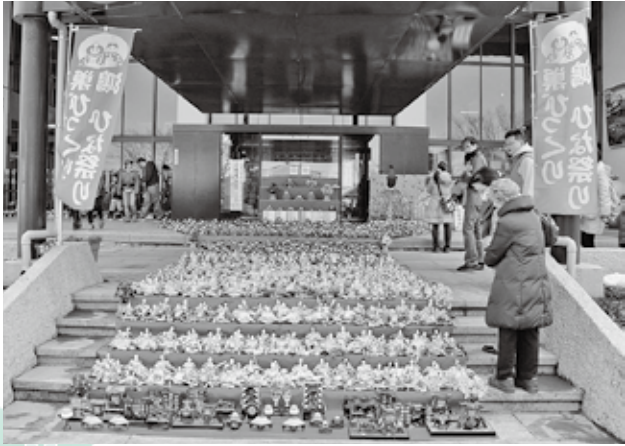
本庁舎正面玄関入口に飾られたひな人形