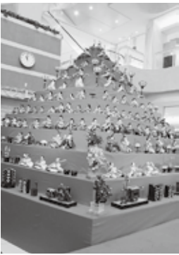
五角すい型ひな壇

パーキングバザール」を開催します。とき／2月14日（出）〜3月7日（出）平日19時〜17時、土・日曜日19時〜16時 ※2月14日10時30分