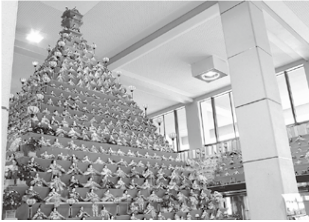
日本一高いピラミッドひな壇

問い合わせ／鴻巣びっくりひな祭り実行委員会（☎080・6615・2015・市観光協会（☎540・3333）・商工観光課観光担当（内線2401）