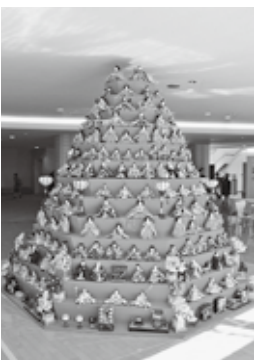
八角すい型ひな壇