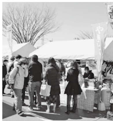
ここのすびっくりパーキングバザール