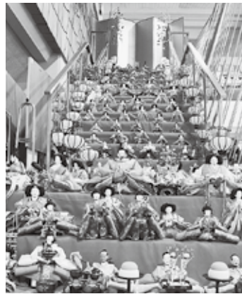
内階段に飾られたひな人形

今年も日本一高いピラミッドひな壇（31段・高さ7m）が登場します。開催期間中の土・日曜日には、市役所敷地内で「ここのすびっくり