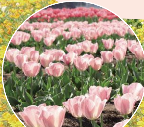
チューリップまつり

関東平野の中心部に位置する鴻巣市は、豊富な日照時間と肥沃な土地を活かし、さまざまな種類の花を育てています。地元の生産者が丹精込めて育てた花苗を、ご自宅やお庭でお楽しみください。