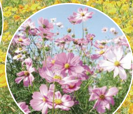
コスモスフェスティバル