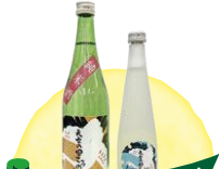
天空の里こうのとりに