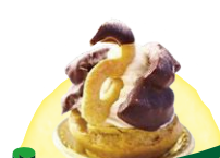
こうのとりにしゅ