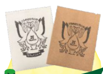
こうのとりにブレンド