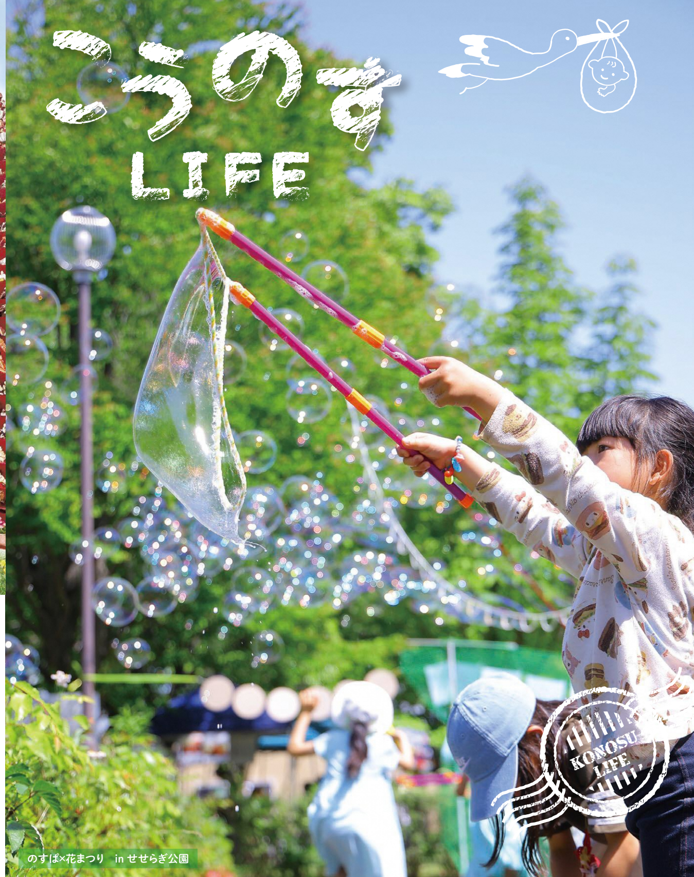
のすば×花まつり in せせらぎ公園