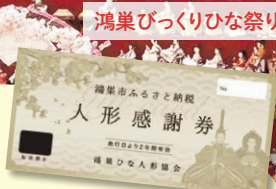
鴻巣びっくりひな祭り