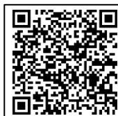
健康づくり教室について

11月8日(日) コスモスアリーナふきあげ、上谷総合公園、川里農業研修センター 11月9日(月) コスモスアリーナふきあげ ※詳細は広報や市ホームページに掲載します。