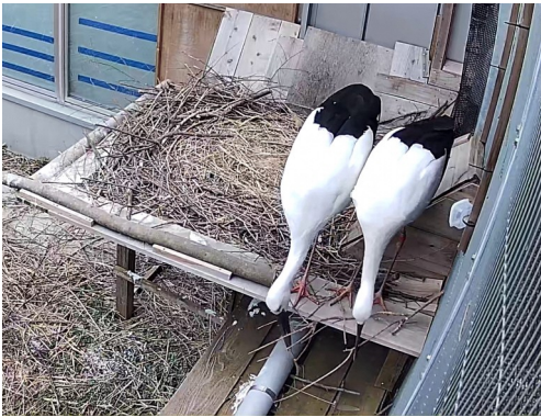
同じ枝をひっぱる2羽

2月14日はバレンタインデーですが、その起源は諸説あるようですが、中にはなんと鳥が絡んでいるものもありました。ヨーロッパでは「2月14日は鳥たちがつがいを作る日」として祝われていたというものです。この頃になると、一足先に鳥たちは春モード。さえずりを始める時期になる、というのが由縁のようです。