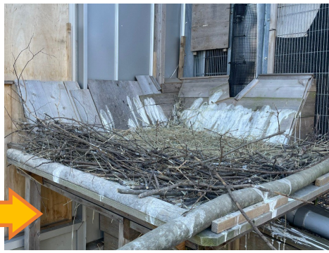
1月18日ごろ（左）と2月4日（右）の巣台