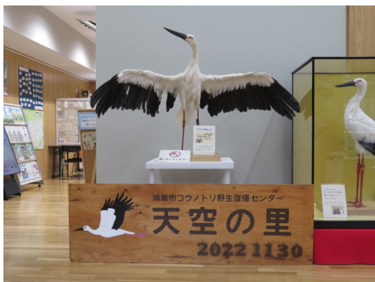
屋内に置いてあるとき