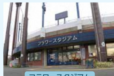
フラワースタジアム