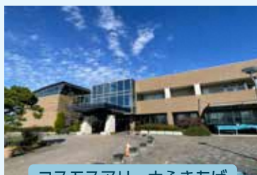
コスモスアリーナふきあげ