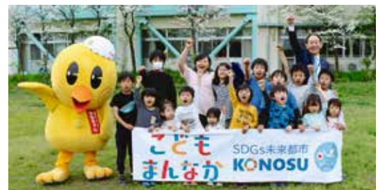
「こどもまんなか応援サポーター」を宣言