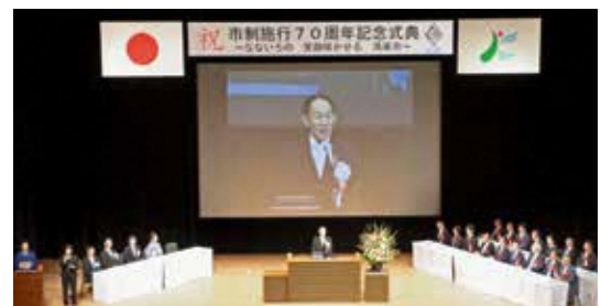
市制施行70周年記念式典を挙行