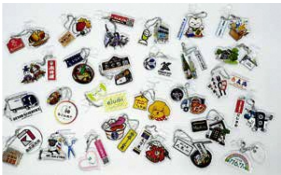
『鴻巣ガチャ』は、エルミここのすなど、市内6か所に設置されています。まもなく第5弾がスタートします！

「鴻巣の魅力を再発見してもらいたい」という思いから流行りのご当地ガチャに着目して企画したもので、ひな人形、川幅うどんなどの市の特産品や市