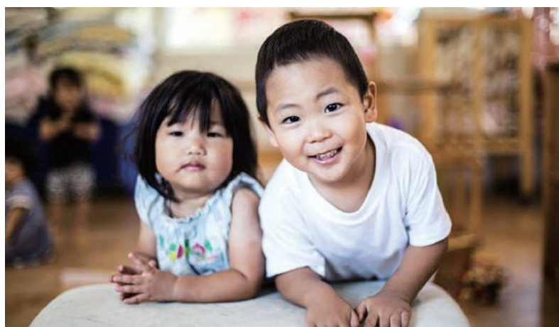
例えば、子どもの笑顔のために

遺贈寄付をご存じですか？ 遺産の「遺」に「贈る寄付」と書いて、遺贈寄付。 ご自身の遺産を、社会貢献のために 寄付する取り組みです。 日本財団なら、子どもや被災地の支援など、 さまざまな遺贈先をお選びいただけます。 金額の多寡に関わらず、 遺産の一部だけでも遺贈できます。 ぜひお気軽にお問い合わせください。