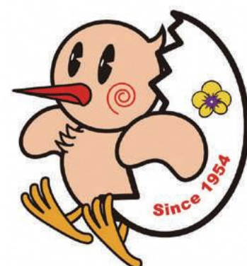
鴻巣市メインキャラクター 「ひなちゃん」

発行 鴻巣市 介護保険課 編集／発行 株式会社鎌倉新書 発行年 2025年12月