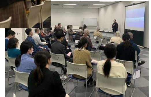
国際交流フェスの様子