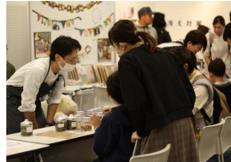
親子交流フェスの様子