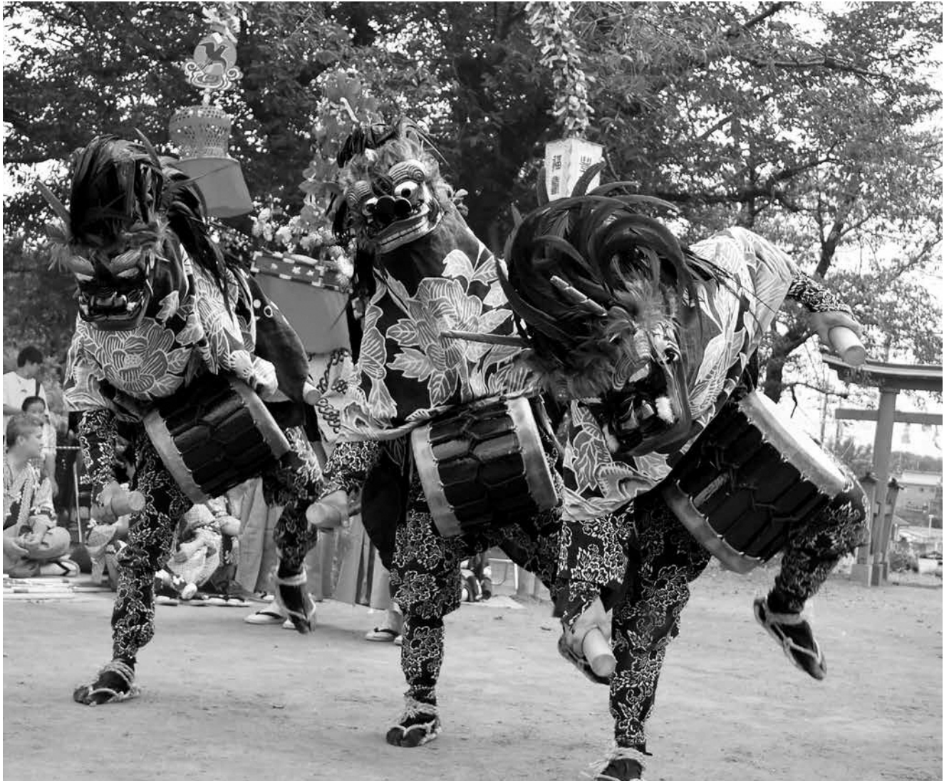
ささら獅子舞（原馬室）